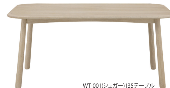
WT-001(シュガー)135テーブル